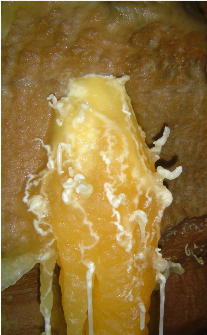
Bild oben: Bleißberghöhle West (TH) Stalagmit mit weißen Excentrique aufgenommen während der Erstbefahrung 04/2008